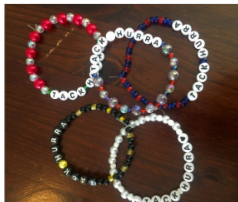
Majas armband finns i alla färger och storlekar, både för barn och vuxna. Alla intäkter går oavkortat till Cancerfonden.