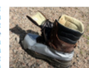
Jakobs kängor klarade inte de 300 milen. De klarade inte ens 100 mil... trots silvertjeplagningar.

– I dag är det rätt skönt, 17 grader kanske. Det ska vara lite kyligt när man går, då blir man inte så varm. Det var ju en värmebölja där i